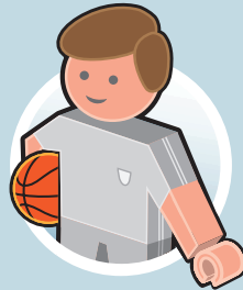
KULTUR, SPORT UND FREIZEIT