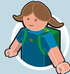
AUSFLÜGE IN KITA UND SCHULE