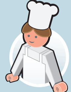
وجبة الغداء في روضة الاطفال و المدرسة و دار الرعاية النهارية للأولاد