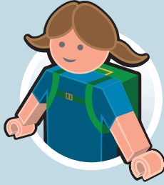
نزاهات في روضة الاطفال و المدرسة

والآن: شاركوا معنا! استعملوا عما هو ممكن محليا. كلموا ايضا على مقربة منكم النوادي التي لم تساهم بعد في حزمة التعليم. قدموا الطلبات في ابكر وقت ممكن و احفظوا الايصالات و الفواتير و اوراق التسجيل. هذه الانجازات متاحة في حزمة التعليم: